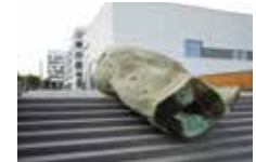
Gereon Krebber 2016, Gesundheitscampus NRW der Hochschule für Gesundheit (hsg)