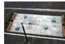
Yuji Takeoka 2015, Universität Paderborn