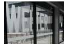
Lawrence Weiner 2008 – 2010, Ruhr-Universität Bochum