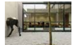
Pia Stadtbäumer 2006 – 2007, Amtsgerichts Lennestadt