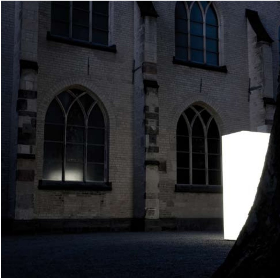
1_ Kunst-Station Sankt Peter, Köln. Licht- skulptur von Simon Ungers