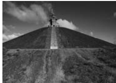
RHEINELBE – ART IN NATURE

Die besten Architekturen Europas werden mit diesem alle zwei Jahre vergebenen Preis der Europäischen Union gewürdigt. 49 Bauwerke der engeren Auswahlrunde und der Preisträger – das Opern- und Balletthaus Oslo vom Büro Snøhetta – wurden 2010 in einer Ausstellung gezeigt, die durch Europa tourt und nur ein einziges Mal in Deutschland zu sehen war: Viele Interessierte fanden den Weg in die Kokerei Zollverein in Essen in zeitweilig eisige Ausstellungsräume. Eine Kooperation des M:AI mit der Stiftung Mies van der Rohe, Barcelona, und dem DAM Deutsches Architekturmuseum Frankfurt.