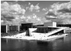
MIES VAN DER ROHE AWARD FOR EUROPEAN ARCHITECTURE 2009

Die besten Architekturen Europas werden mit diesem alle zwei Jahre vergebenen Preis der Europäischen Union gewürdigt. 49 Bauwerke der engeren Auswahlrunde und der Preisträger – das Opern- und Balletthaus Oslo vom Büro Snøhetta – wurden 2010 in einer Ausstellung gezeigt, die durch Europa tourt und nur ein einziges Mal in Deutschland zu sehen war: Viele Interessierte fanden den Weg in die Kokerei Zollverein in Essen in zeitweilig eisige Ausstellungsräume. Eine Kooperation des M:AI mit der Stiftung Mies van der Rohe, Barcelona, und dem DAM Deutsches Architekturmuseum Frankfurt.